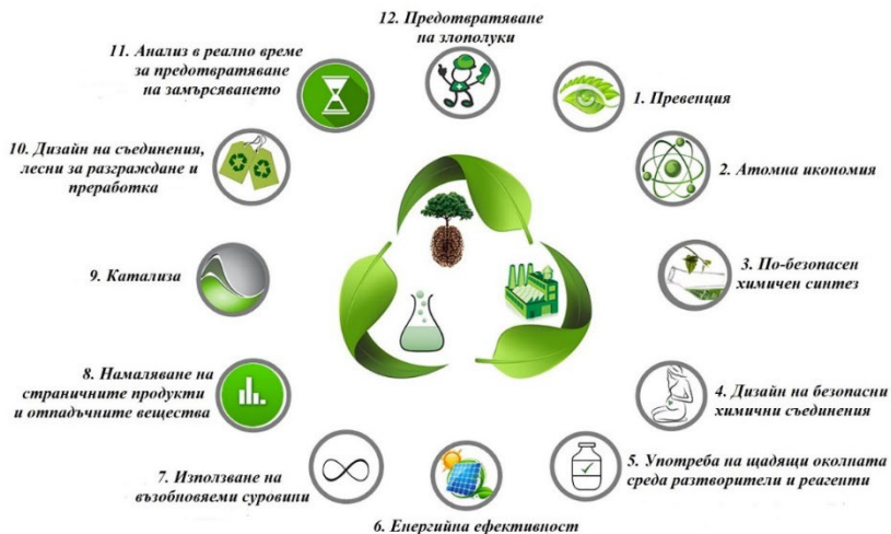
Фигура 2. Основни принципи на зелената химия